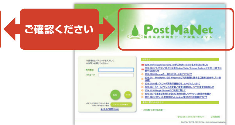
【図2】製造販売後調査データ収集システム